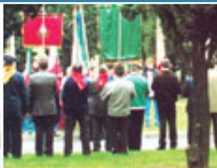
Due fasi della cerimonia del 3 novembre nel ricordo dei Caduti.

L a vittoria del 1918 sull'esercito austro-ungarico, gli oltre cento nembresi tra i 600 mila caduti italiani di quel conflitto, l'omaggio alle Forze armate oggi impegnate su frontiere di pace, l'auspicio di uno spazio per il volontariato nel servizio militare professionalizzato, gli sforzi di Stati ex belligeranti per incontrarsi nell'Europa unita, le vittime del terremoto nel Molise, il dovere della memoria e l'impegno degli